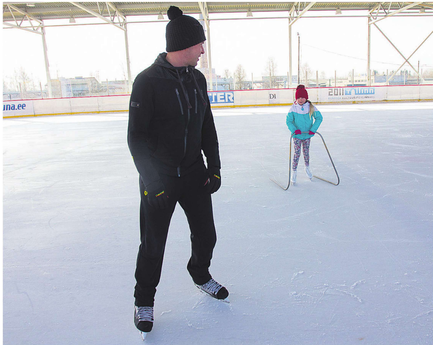
Ehkki uisutajaid on tänava väljakul käinud palju, ei jätku piletitulust, et suurt elektriarvet maksta.

Riigikohus andis riigi ja Edelarauttee vahelises kohtuvaidluses õiguse riigile ning lubas tal sõlmida lepingu endale kuuluva ettevõttega ilma konkursita. Kohtuotsuse kohaselt jääb jõusse riigi ja Elroni vaheline nelja aasta pikkune leping.