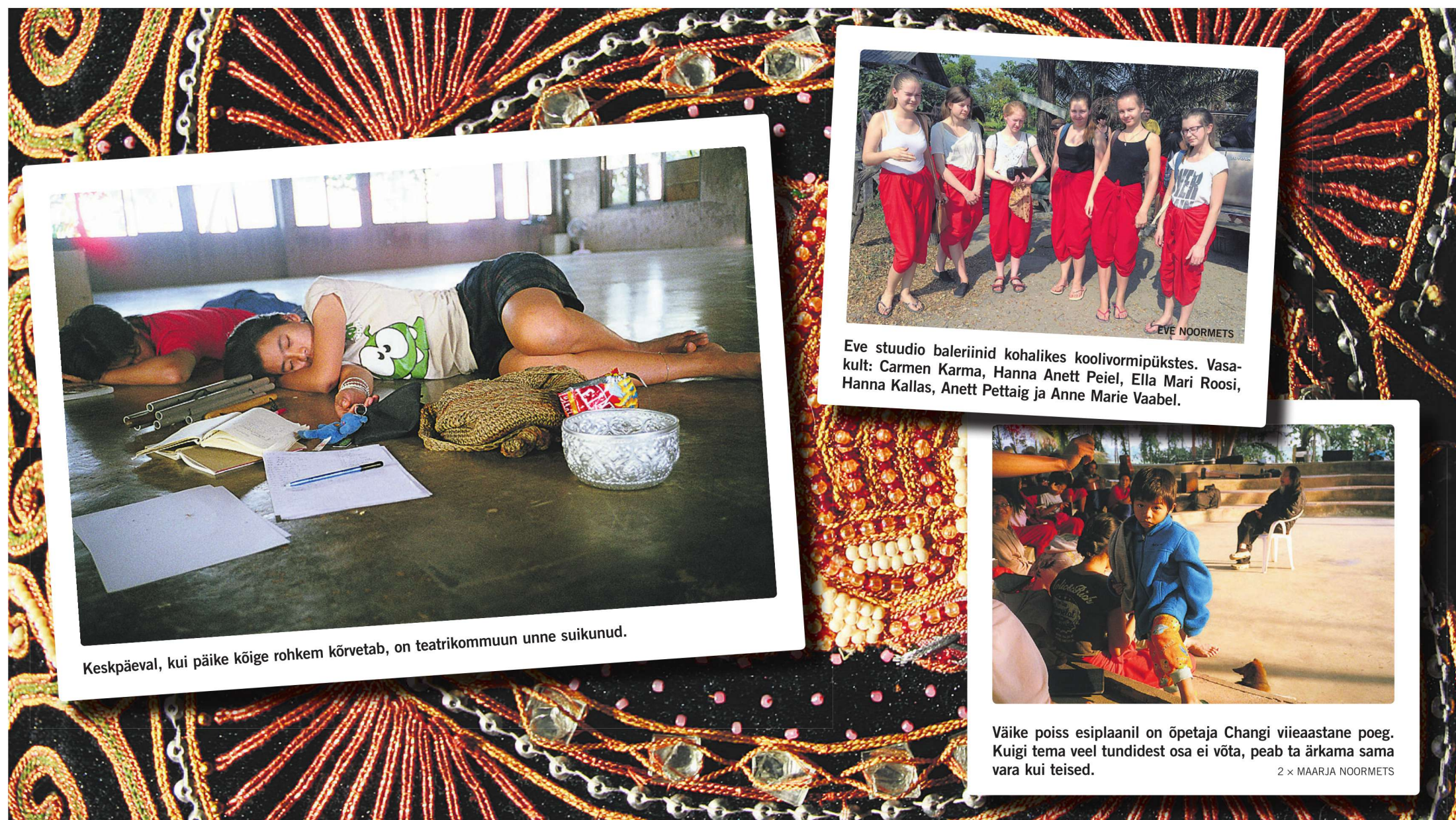
Keskpäeval, kui päike kõige rohkem kõrvetab, on teatrikommun unne suikunud.