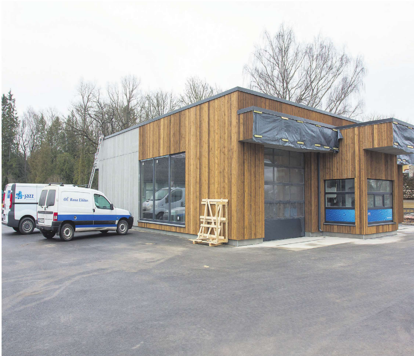
Viljandist saab Tallinna, Tartu, Paide ja Keila kõrval viies linn, kus Jazz Pesulate kett on esindatud. Siin on kavas paari nädala pärast lahti teha automaatpesula, mis suudab korraga ette võtta kaks määratud sõidukit.

Maksu- ja tolliameti andmetel laekus omavalitsustele tänavu kahe esimese kuuga tulumaksu 1 294 000 eurot, mis on üle 10 protsendi rohkem kui 2013. aasta samal perioodil.