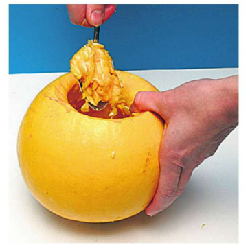
Kõrvitsaseemnetes on rohkesti mineraale.