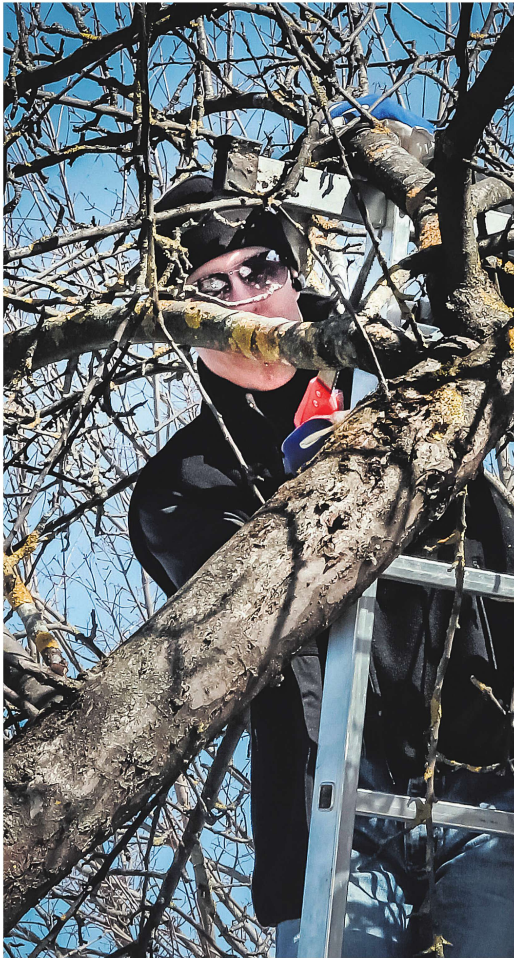
Kaua hooldamata puult ei tohi korruga eemaldada üle kolmandiku võrast.

«Puid vaadeldes on näha, et vanad lõikehaavad on halliks muutunud ja osal võib näha pehkimist. Sellist kõdune-