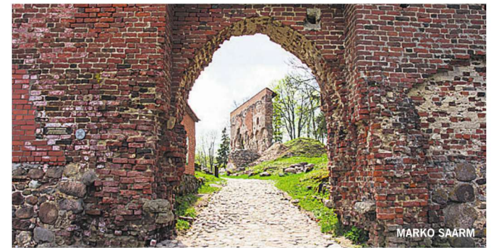
Restaureerimine ja konserveerimine jätkuvad Viljandi ordulossi varemetes ka tänavu, kuid toetust tuli varasemaga võrreldes vähem.

«See aeg on peagi käes, enne tuleb asi ju ka läbi mõelda ning koostada tegevuskava koos kalkulationsidega,» rääkis ta. «Omanikele on eelarveaasta lähemale toodud, kalkulationsioonid sõltuvad ehitushindade kallinemisest ja kui need teha liiga pika aja peale, võib hind juba märgatavalt kerkida.»