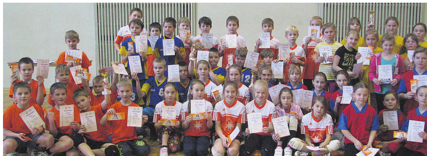
Viljandimaa suurte koolide vahel peetud rahvastepalli turniiril osales kuus tüdrukute ja seitse poiste võistkonda. Pildile tulid autasustatute sekka jõudnud võistkondade liikmed.

Mõlemad maakondliku turniiri võitnud võistkonnad osalevad täna Viljandi spordihoones peetaval Eesti koolisporti liidu piirkonna võistlustel.