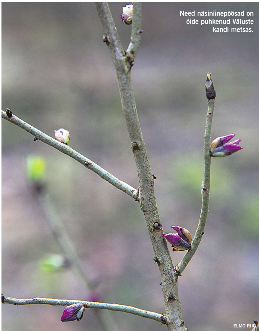
Need näsiniinepõõsad on õide puhkenud Väluste kandi metsas.