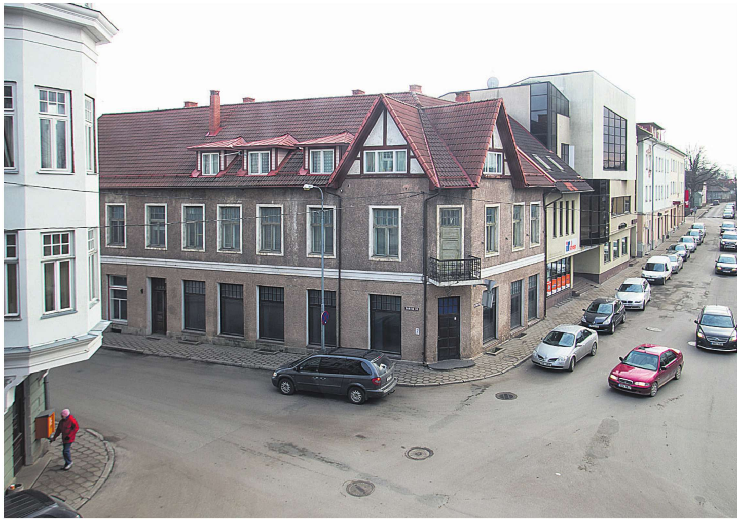
Keskväljaku ääres seisev kolmekorruseline maja on aastaid kaunistanud Viljandi linna esindusfotosid. Selle sisemus on aga üsna õnnetu. Mitu ülemiste korruste korterit on kehvast seisust ning alumine korrus täiesti tühi.

Riik jagab linnadele ja valdadele tänavu 206 miljonit eurot haridustoetust, mille hulgas on ka 166 miljonit eurot õpetajate palgaraha. Seda on mullusega võrreldes üheksa miljoni euro ehk viie protsendi võrra rohkem.