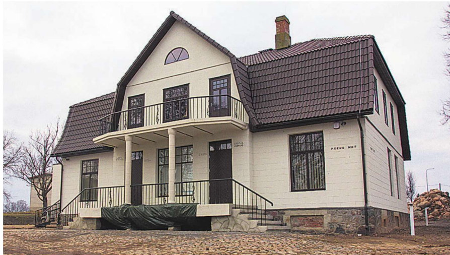
Kõpu meierei säilitas imposantse väljanägemise isegi siis, kui see tühjana seis ja lagu- nes. Nüüd, korrrastatud katuse ja fassaadiga mõjub maja eriti toretsevalt.