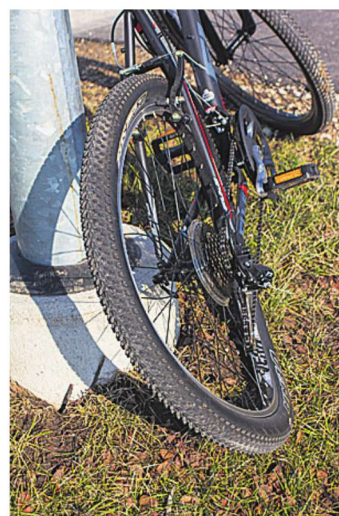
Velokatse lõpul sõitis fotograaf tagaratta kõveraks.

Teen mõlemale poole kokku kuus katset. Kui esimest korda pedaalil teelõigu läbi 11,21 sekundiga, siis päeva parima ajana läheb kirja 8,02 sekundit. Ehk saanuksin veel kiiremini, aga lisaks juhtraua hoidmisele ja pidurdamisele hoian ühes käes stopperkella ning möödan ise oma aega.