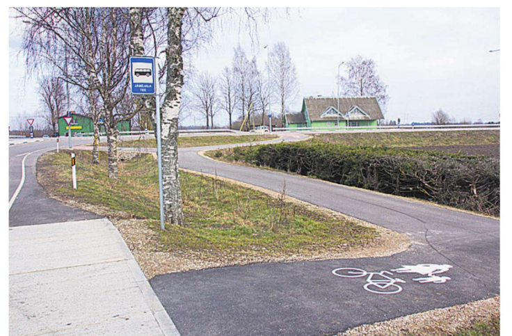
Lühike ei pea olema igav. Sel kergliiklustee jupil kohtab mitut kurvi ning vaadegi vaheldub.