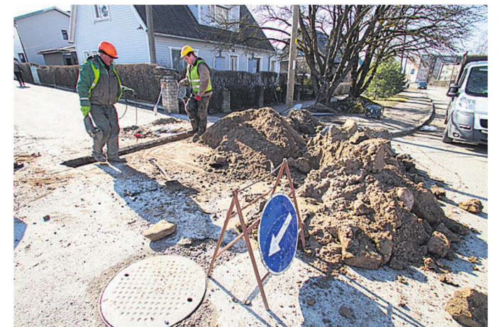
Viimati kaevati Suur-Kaare ja Loode tänava ristmik mõneks ajaks üles eelmise nädala kolmapäeval.

Teearu lisas, et kui midagi erakorralist vahele ei tule, siis sel ja tuleval aastal kõnealuse ristmiku piirkonnas järgmisi kaevetöid ette ei võeta. «Aga välistada seda muidugi ei saa,» lisas ta.