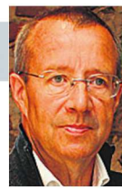
TOOMAS HENDRIK ILVES

Esiteks peame NATO-s otsustavalt tegutsema. Senaator Lugari kunagine maksimist traditsioonilisest piirkonnast väljumise või tegevuse lõpetamise kohta ei ole enam asjakohane. Me oleme ilmselgelt piirkonnas tagasi. Nüüd peame taas tegutsema.