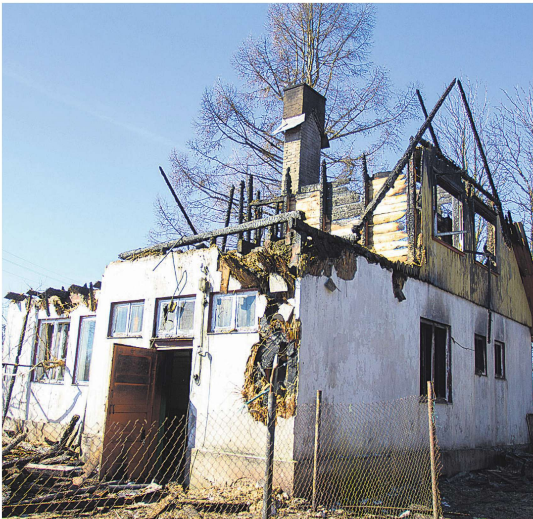
Elumaja Suure-Jaani lähedal Ängi külas langes tuleroaks laupäeva öösel. Pilt on tehtud kümnekond tundi pärast põlengu puhkemist.

Rongifirma juhib tähelepanu sellele, et lühikese ooteplatvormiga peatustes, nagu on Kärü, Taikse, Kärevere ja Ollepa kõrval ka Sürgaveres, tuleks teekonda alustada sõidusuunapoolses rongis või esimesel võimalusel sellesse ümber istuda. Ainult selle rongi ukseid avanevad nimetatud lühikese ooteplatvormiga peatustes.