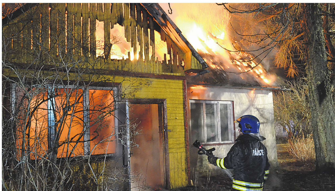
Kui päästjad kohale jõudsid, oli hoone juba leekides.