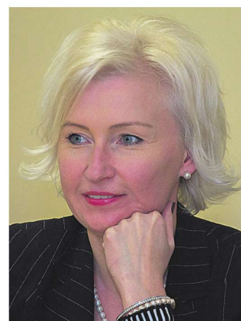
Europarlamenti liige Kristiina Ojuland