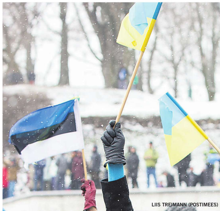
LIIS TREIMANN (POSTIMEES)

NATO olemasolu mõte seisneb alliansi liikmete ja nende territooriumi kaitses. Me peame viivitamata astuma samme, et tagada NATO kohalolek kogu alliansi territooriumil. Praeguses keskkonnas, mida iseloomustab 1930-ndate stiilis sõjahüsteeria Moskva ametlikus meedias («Venemaa on ainus riik, mis suudab muuta Ameerika Ühendriigid radioaktiivseks tuhaks,» nagu Venemaa riigiteleviiooni juht hiljuti teatas), saab ainus kiire vastus olla rahulik, ent kindel heidutus.