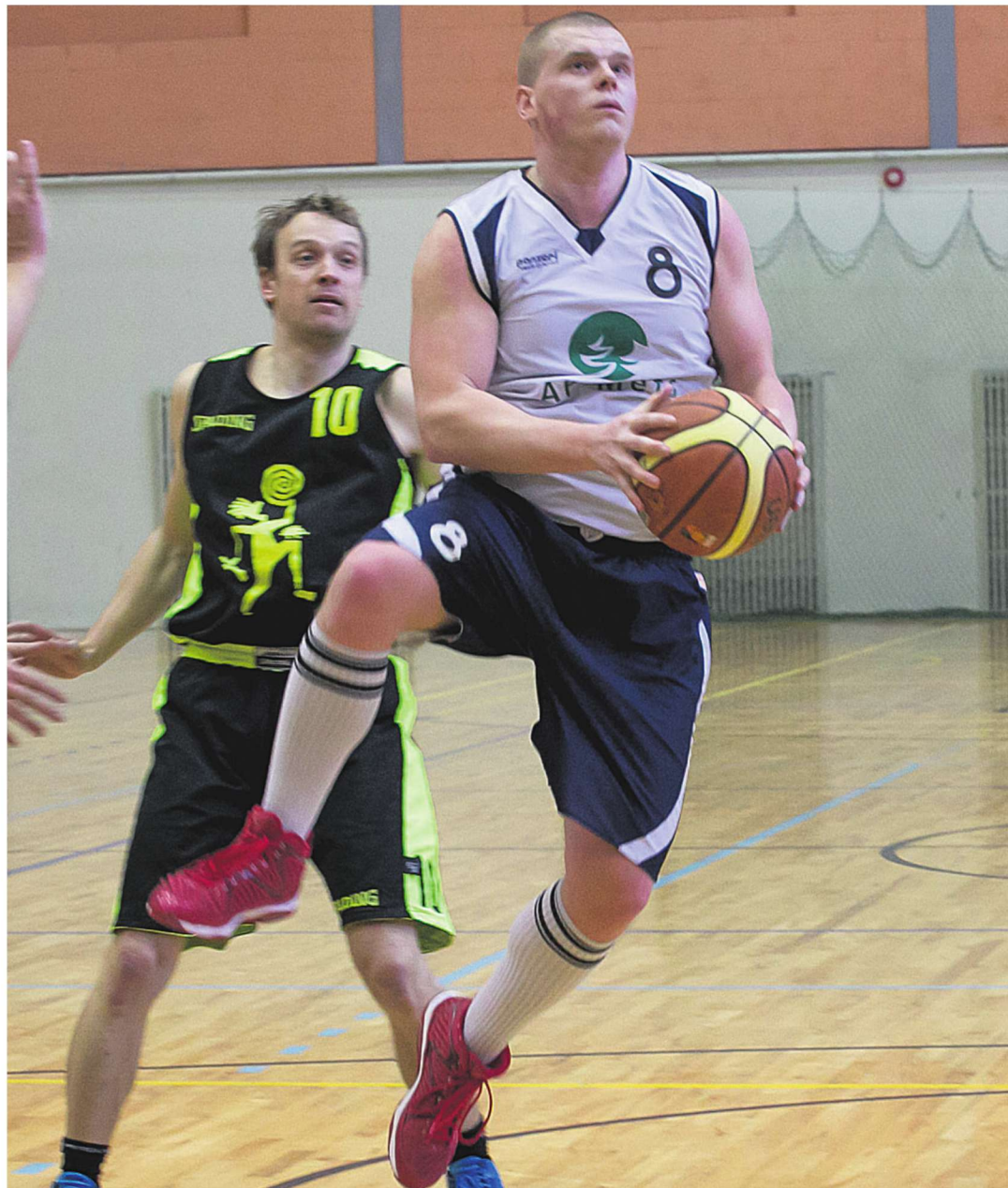
Maakonna korvpalli meistrivõistlustel seisab ees lõppvaatus. Kahe mänguvõiduni peetavad finaalseeriad algavad laupäeval. Pilt on tehtud AP Metsa ja Tõrva meeskonna veerandfinaalmängust.

Seitsmenda ja kaheksanda koha pärast mängu ei peetud, sest mullu maakonna meistriks tulnud Hansa Ilutulestikud loobus sellest võitlusest. Seega lõpetas Pärsti tänavu seitsmenda ja tiitlikaitsja kaheksanda kohaga.