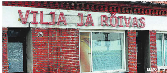
Avamise eel varjasid kaupluse Vilja ja Rõivas sisemust stiilsed eesriided.

Opositsioonilise Isamaa ja Res Publica Liidu ridades riigikokku valitud Toomas Tõnis- te hinnangul püüab Rõivas ettevõtluskatsetusega vabaneda poliitbroileri kuvandist ja näi-