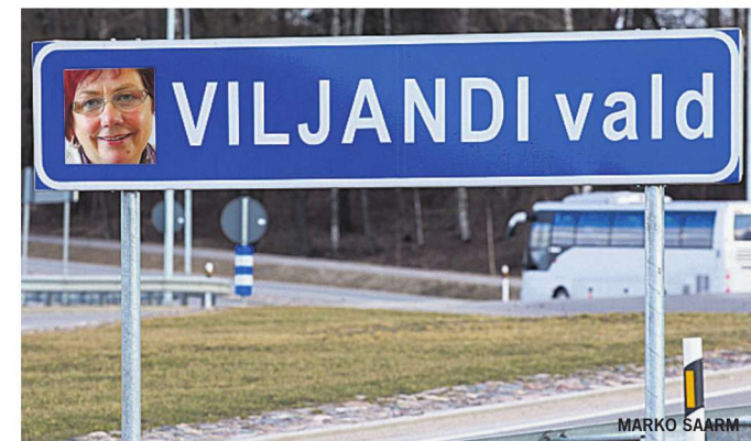
Prague tervitab Viljandi vallavanema portree mõeldujaid mõne suurema tee ääres, sealhulgas Tartu maantee alguses.

«Aga olgem ausad: miks ei võiks vallavanema pildi asemel kasutada volikogu esimehe pilti?» lisas ta.