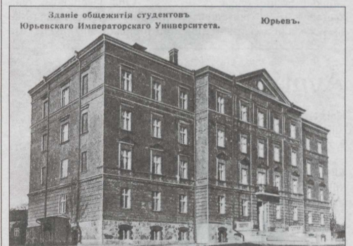
Ülikooli esimene ühiselamu.