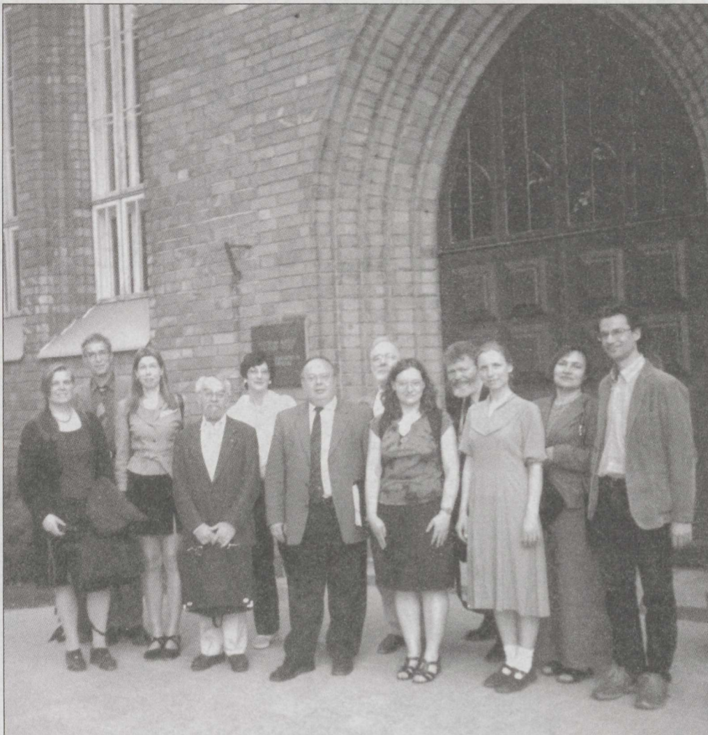
Konverentsi korraldajad ja külalisesinejad ajaloo muuseumi ees.