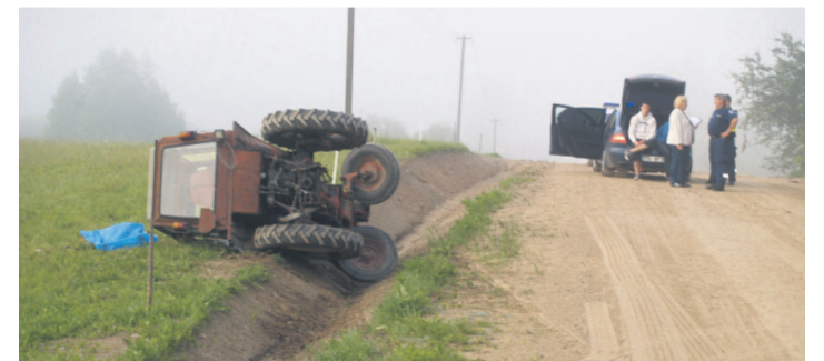
Traktori alla jäänud mees suri.

21. juulil avastati, et Karula vallas Lüllemäe külas on talu hoovalt varastatud registreerimata ratas-traktor T-25. (VM)