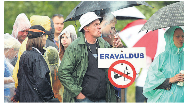
Autoralli jälgimine selleks ettevalmistatud kohtades tähendas teatud reeglite järgi käitumist. Paraku leidis ka neid, kes keeldusid millekski ei pidanud.