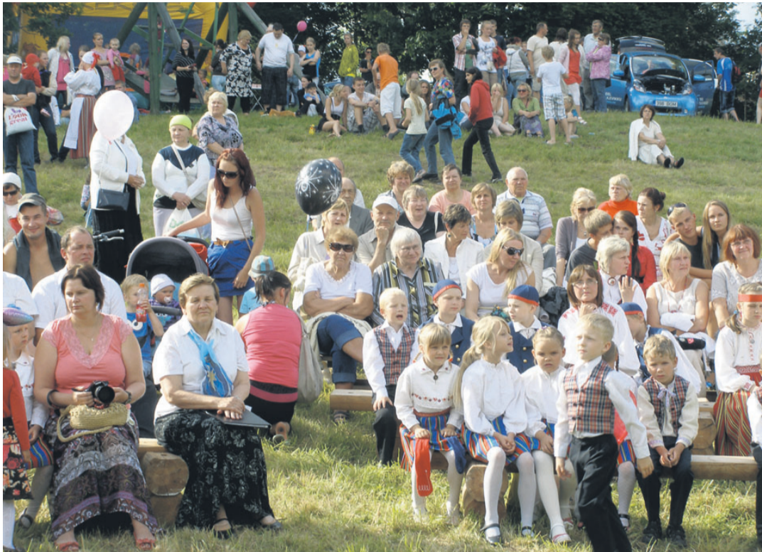
Rahvas on kogunenud Helme lauluväljakule järjekordsest valla päevast osa saama.