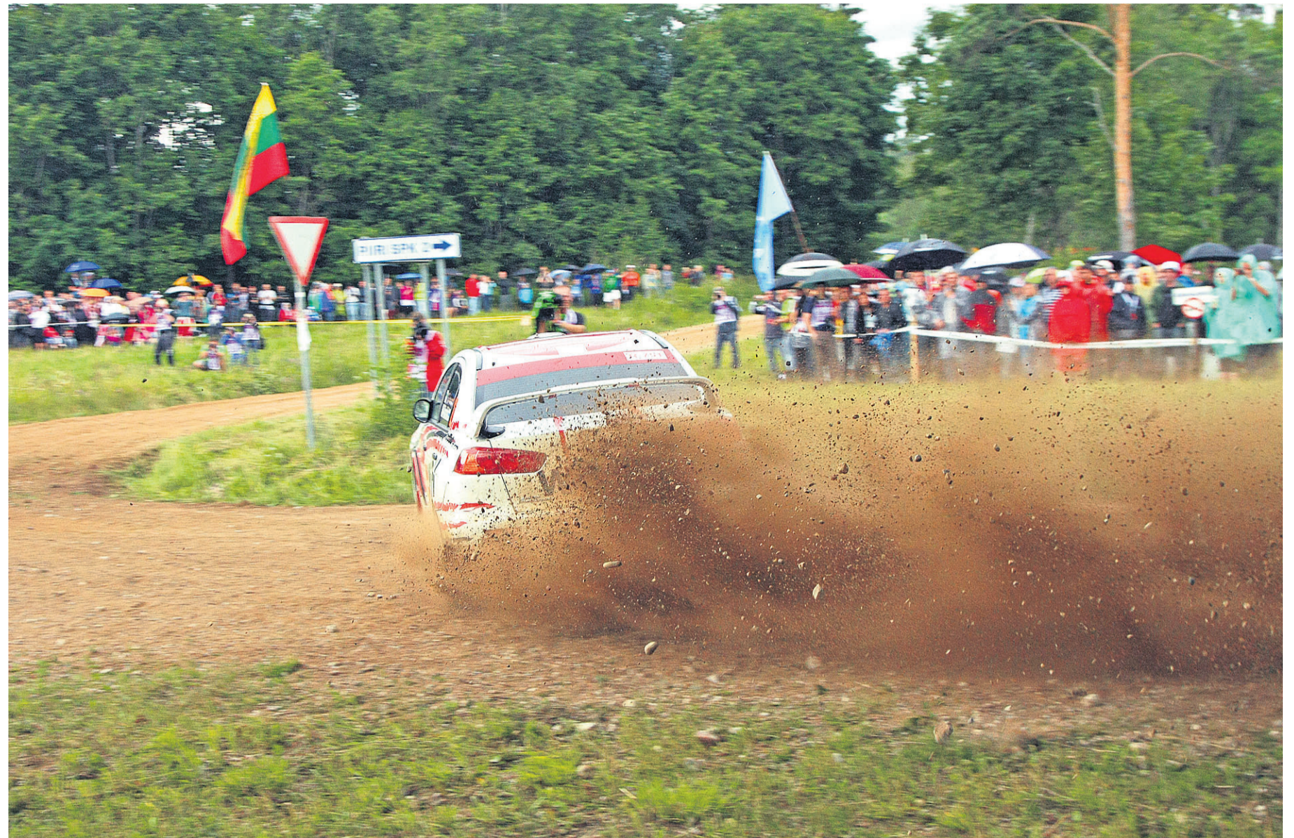
Rajale väga lähedal seista ei tasunud mitte ainult võimaliku teelt väljasõidu ohu tõttu, vaid ka selle pärast, et võimsad masinad läbisid kurve efekitse kruusasaju saatel.

Tema sõnul andsid nad lõpus pisivigade tõttu veel paar kohta ära, ka muutis tulemuse kehveks vihmasadu. «See pole ikkagi meie koht,» lausub rallisõitja ja tõi välja, et ideaalis tahtnuks nad oma masinaklassis lõpetada esikolmikus ja üldarvestuses esiküm-