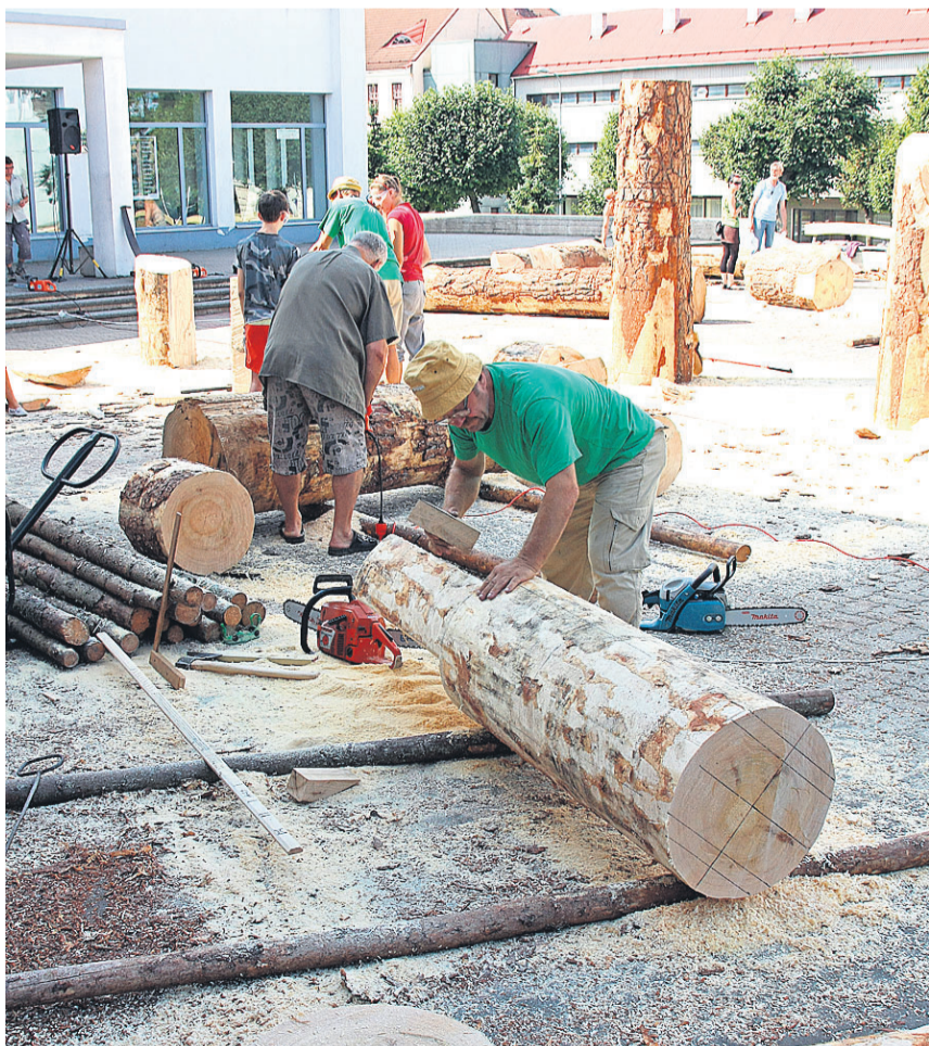
Juba aastaid korraldatakse Valgas jõukatsumisi puuskulptuuride valmistajate vahel, millest võtavad lisaks eestlastele osa mitme välisriigi puutöömeistrid.