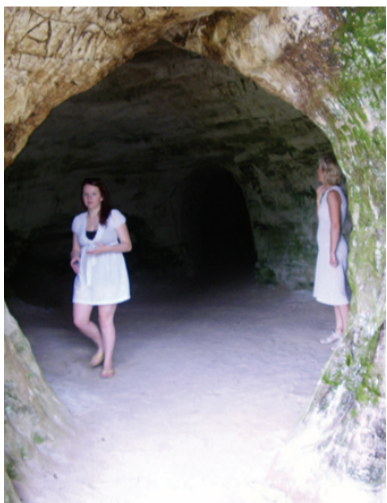
Helme koopad — paopaik või pargirajatis?

vaidlustanud arheoloog Arvi Haak, kes on proovikaevanditega püüdnud selgitada linnuse rajamise aega ja linnusehoovi ladestunud kultuurikihi vanust ning iseloomu. Linnuse ehitamise aeg pole senini teada. On välja pakutud 13. sajandi teist poolt, 14. sajandi algust, ka