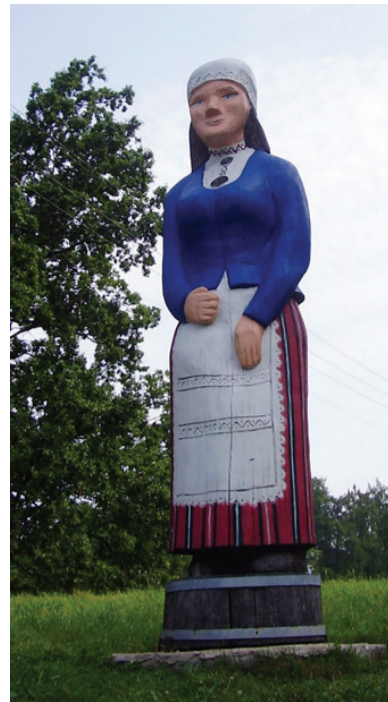
Helme rahvarõivastes mulgi naine.