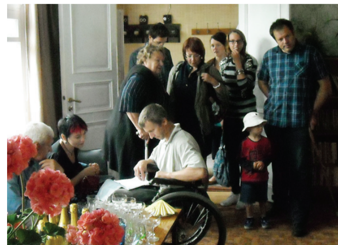
Rahval oli uues majas rohkesti vaatamist.