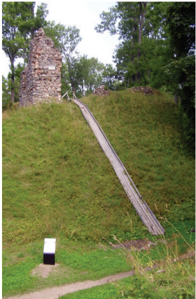
Helme ordulinnus paiknes kohati kuni 20 m kõrgusel neemikul.

Sellest kohast naljalt peatumata mööda ei sõida: maalilises roheluses kõrgel üleval püüavad pilku puude vahele peituvad varemed. See on Pärnu–Tõrva–Valga ja Viljandi–Kärstna–Helme tee ristumiskohas asuv keskaegne maakivist Helme linnus. Muidugi jätab oma senise reisiplaani kus seda ja teist ning tõused mööda puupakkudest rada varemeteni. Kui suur ehitis see kunagi võis olla! Kahe vallikraaviga eraldatud looduslikul neemikul on paiknenud pealinnus, mis on olnud väljavenitatud ovaali kujuline. Linnust on ümbritsenud kivimüür, milles praegugi veenduda võid. On oletatud, et samas kohas asus juba ka eestlaste (sakalaste) muinaslinnus. Selle oletuse on