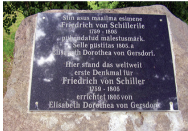
Mõisaproua armastusest sündinud obeliski mälestuseks.