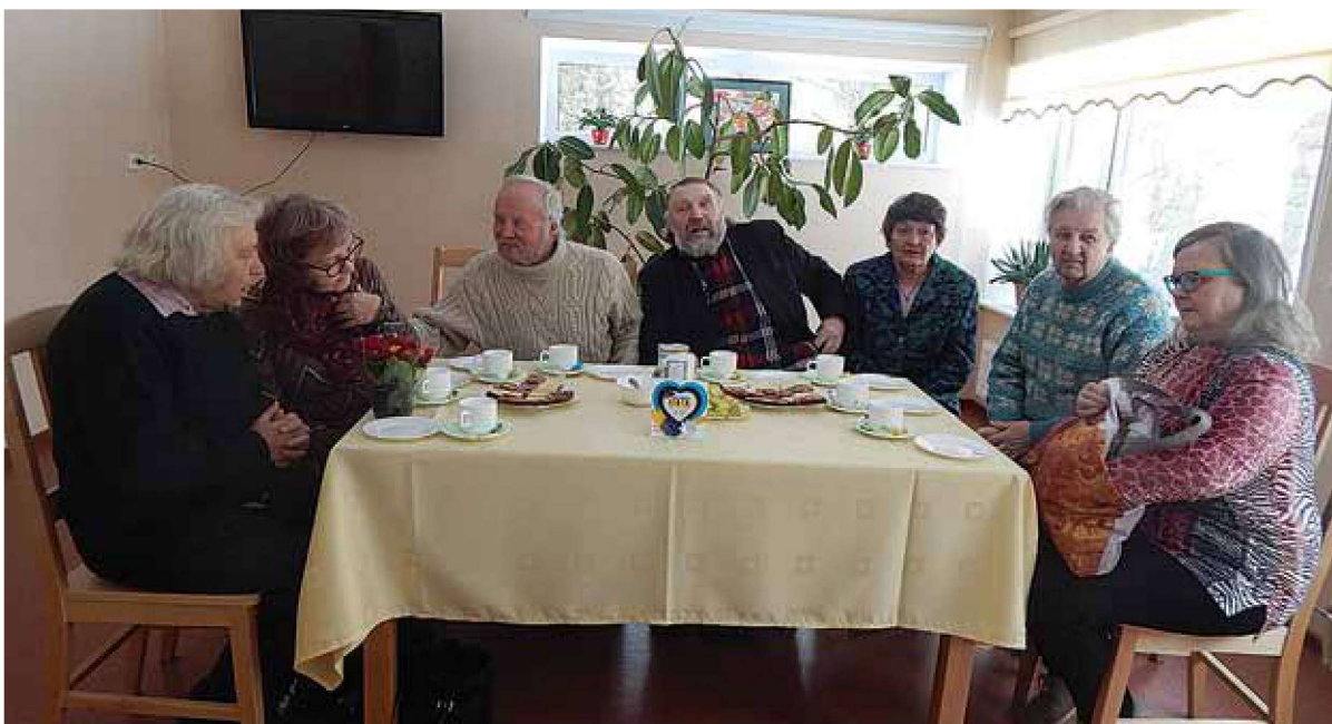
Luuleklubi esindus luulekogumiku esitlusel Viiratsis.