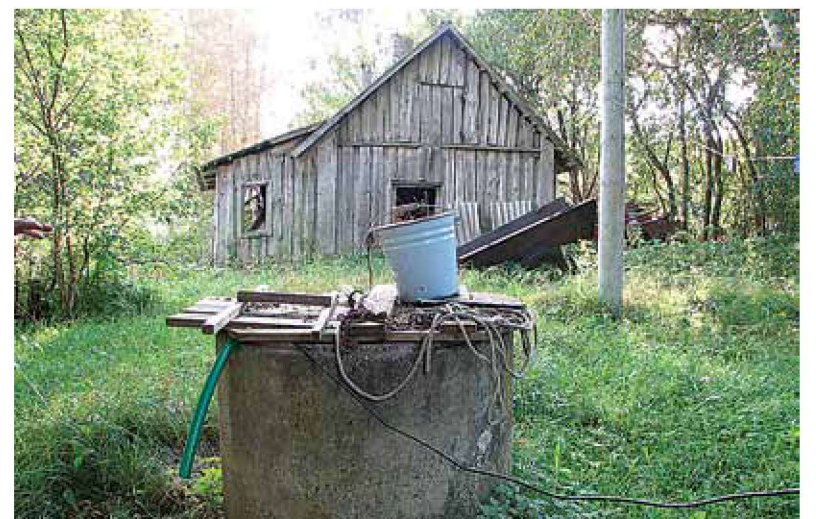
Inimesed, kelle kodus puudub kaasaegne veesüsteem, saavad selle rajamiseks programmist abi küsida.

Taotlus koos vajalike lisadega tuleb esitada hiljemalt 11. juuniks 2018 paberil või digitaalselt