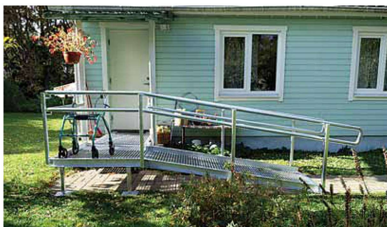
Vald ja riik tulevad puuetega inimestele appi, et eluruumid ja sissepääsud nende vajadustele vastavaks muuta.

Eluruumi sissepääsu kohandamine hõlmab näiteks ukse-