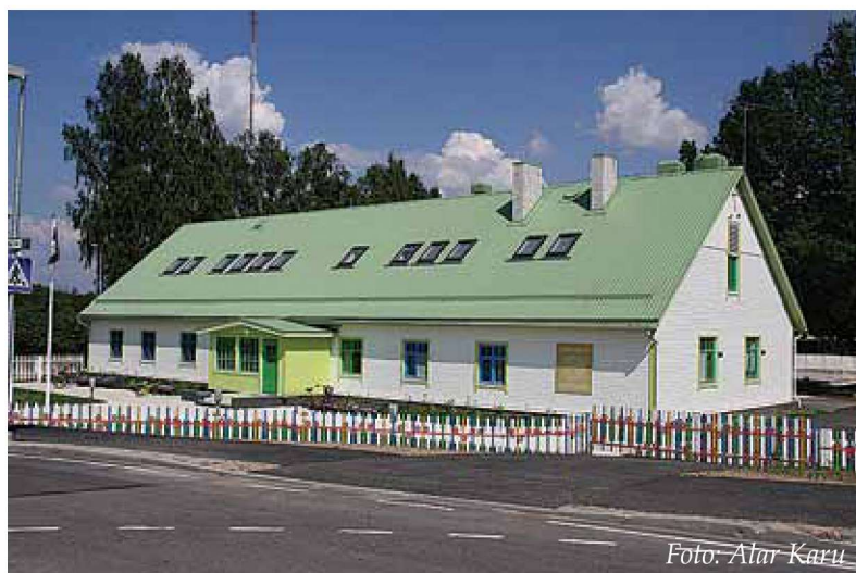
Tarvaste lasteaia Mustla maja on täna avatud ka suvekuudel.

suletud 1. juulist 5. augustini, avatakse 6. augustil.