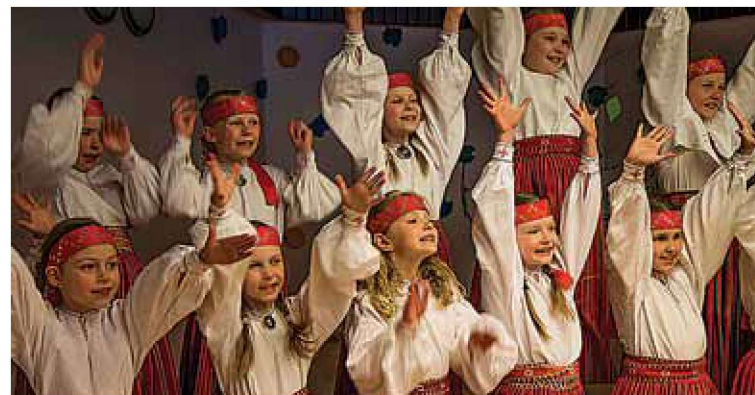
Mudilaskoori lapsed 2017. aasta kevadkontserdil.

Viiratsi Koolil on põhjust tähistada oma tähtsat veerandsaja aasta pikkust tegevust ja sünnipäeva 3. mail oma koolipere ringis ja 4. mail 2018 Viiratsi laululaval.