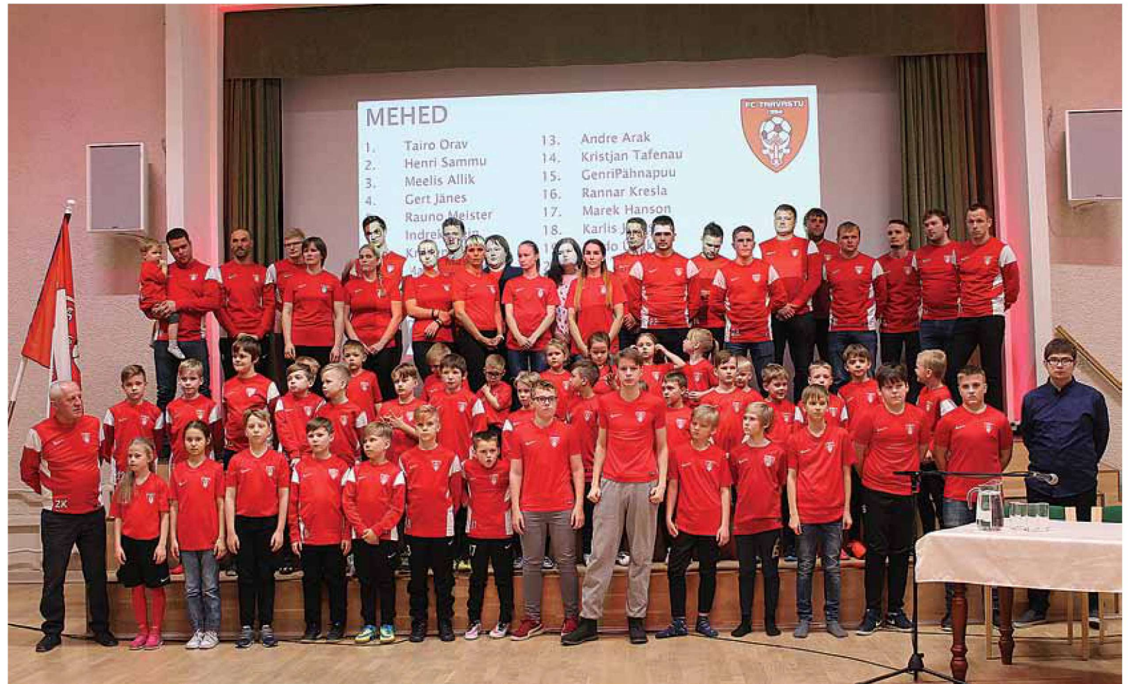
1994. aastal asutatud FC Tarvastu on aastatega üha suuremaks paisunud. Jalgpalli mängivad nii mehed, naised kui lapsed.

FC Tarvastu poolt korraldatav tähtsündmus on eelmisel aastal taaselustatud noorteturniir Tar-